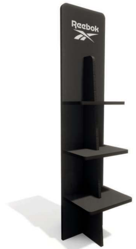
LOGO STAND RBSTAND Ecofriendly Display Dimensions: 36 cm x 146 cm x 6 cm