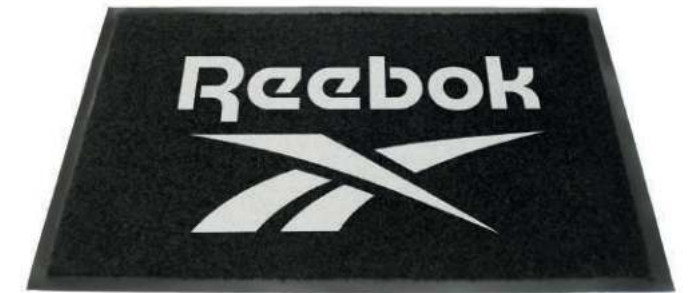
LOGO MAT RBMAT Dimensions: 60 cm x 90 cm