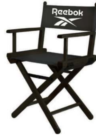
LOGO CHAIR RBCHAIR Dimensions: 49 cm x 72 cm x 34 cm